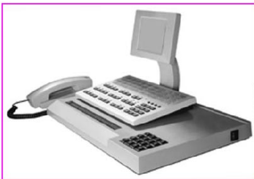
Консоль с терминалом слепой телефонистки

На первых двух модулях строки Брэйля появляется текущий номер строки, за ними следуют два пустых модуля, а за ними остальные 40 знаков Брэйля. С помощью 16-клавишного блока показываемая строка может перемещаться вверх и вниз. Индикация на терминале слепого оператора может отображаться шрифтом из 6 или 8 точек.