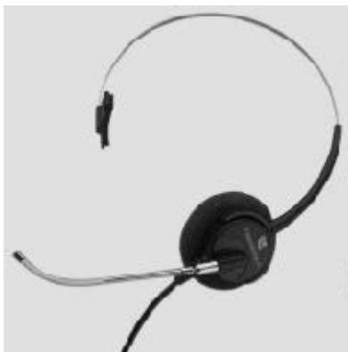
Гарнитура с оголовьем